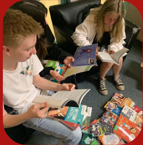
Des élèves de l'école Maurice-Lavallée utilisant les ressources en santé mentale

Pour en savoir plus, visitez : vice-versa.ca